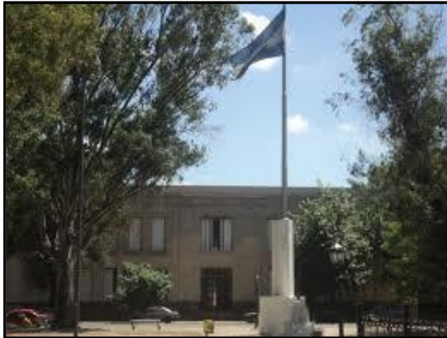
"Escuela N°1 José de San Martín"