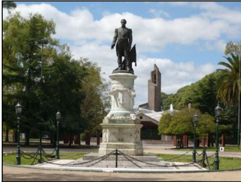
"Monumento al Almirante Guillermo Brown"

Se trata del primer monumento del Almirante Brown realizado por un artista argentino y su inauguración contó con la presencia del Dr. Carlos Pellegrini en representación del Presidente de la Nación.