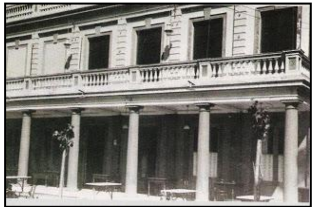
"Hotel La Delicia y sus galerías"