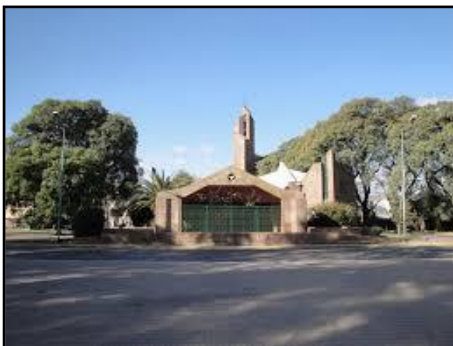
"Actual Iglesia San Gabriel"