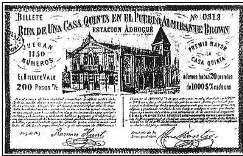
"Bono Rifa de La Cucaracha"

En La Cucaracha funcionaron el primer Gobierno Municipal; el Juzgado de Paz y la Comisaría, Sede de la Secretaría de Educación y Cultura y actualmente es el Museo y Archivo Histórico Municipal.