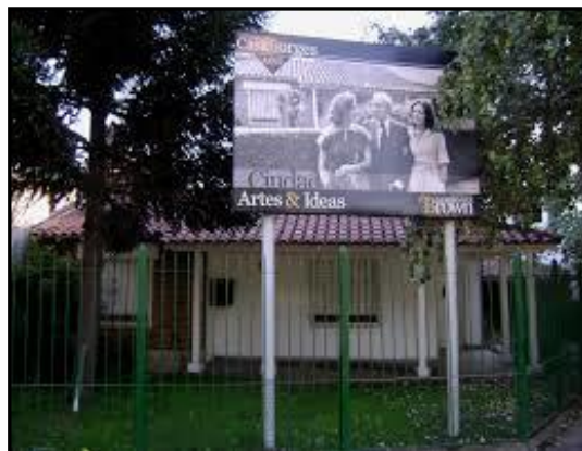
"Casa de la Familia Borges en Plaza Brown 301 adquirida por el Municipio en 2012"