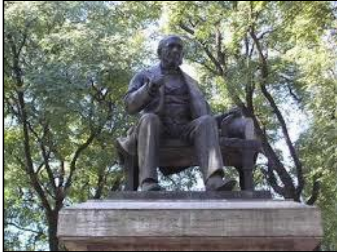
“Monumento a Don Esteban Adrogé”