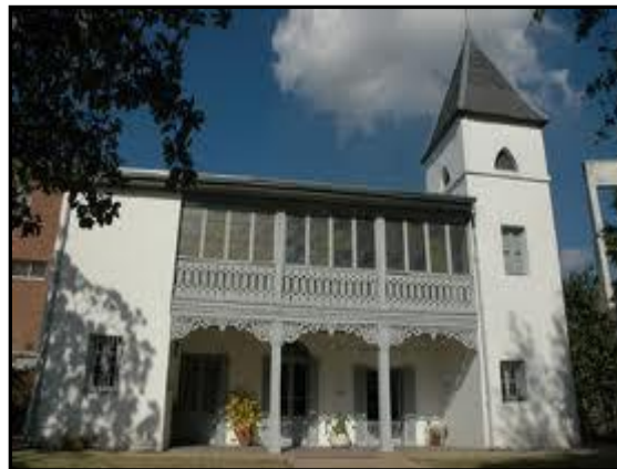
"Imagen actual de La Cucaracha"

En La Cucaracha funcionaron el primer Gobierno Municipal; el Juzgado de Paz y la Comisaría, Sede de la Secretaría de Educación y Cultura y actualmente es el Museo y Archivo Histórico Municipal.